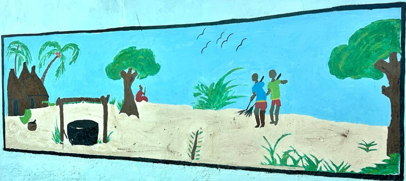
Une des belles fresques murales réalisées par des volontaires

Maison de la Gare s'efforce à promouvoir le bien-être des enfants talibés de tout âge, à leur donner la possibilité d'avoir une vie saine et productive.