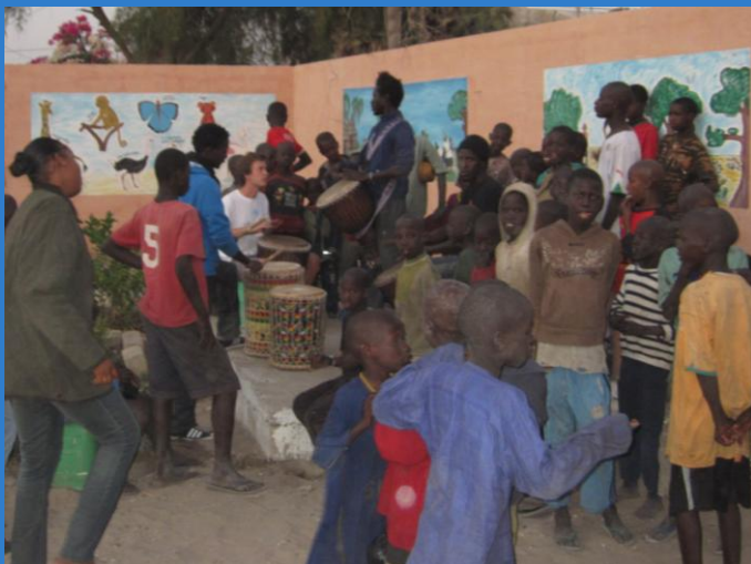
Volontaire en pleine forme au djembe, avec les talibés